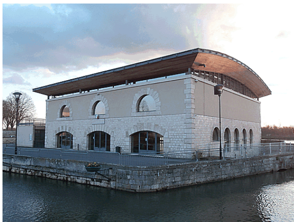
Salle municipale dite « de la Chaussade »

La ville de Cosne, propriétaire depuis 1905, entreprendra alors une transformation de ce site remarquable, où la force de l'eau et l'intelligence des hommes s'étaient associées pendant trois siècles, pour déployer de belles industries.