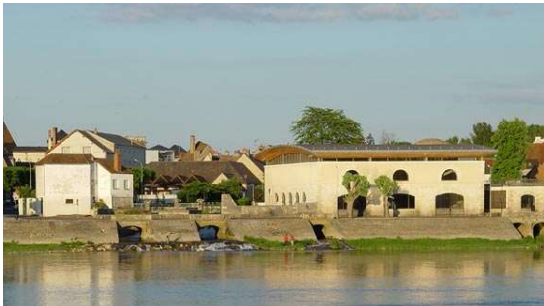
Site des anciennes forges de Cosne, au confluent du Nohain