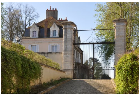
Ancien portail des forges